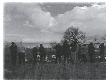
寒い冬でも、水鳥たちには熱い視線が送られます。

カラヤマガラの巣箱作りは親子での参加が多い企画。今年もフクロウの巣箱作りも計画中。最近では大きな木が減少し、フクロウの住宅難だそうです。