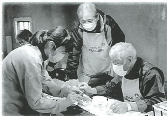
開院時間は、毎月第一日曜日 11:00 ~ 15:00。(受付は14:00まで) ・荒天の場合など、休院することがあります。

2019年、高島市社会福祉協議会が主催した「おもちゃドクター養成講座」。受講したメンバーがその後も自主的に勉強会を開催しているうちに、実践できる場所を作ろうという声が上がりました。毎月第一日曜日に今津町のヴォーリス資料館二階で活動を続けられています。