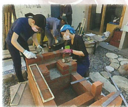
和気あいあい かまどづくり体験

にご協力いただき、関心を持つ方に情報を提供しました。また、移住に関心を持つ方と地域の方や先輩移住者と出会う場づくりとして、「シェアスペース 白湖 (はこ)」と「農家民宿 SPACE まある」とで愛農かまどづくり体験を実施。作業をしながら、いろんな話ができる貴重な時間になりました。