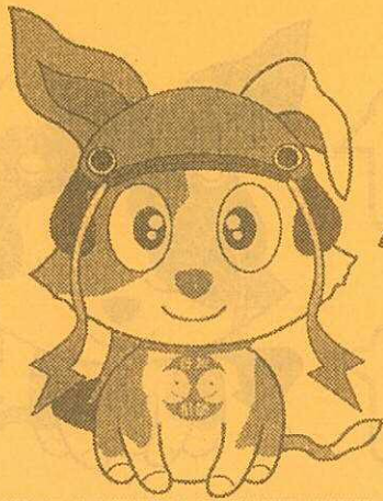
滋賀ご当地キクーン (愛称:びわんこ)