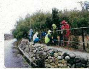
生活環境の緑づくり