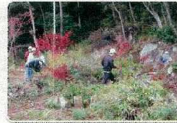
ふれあいの森づくり