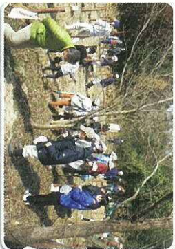
ふれあいの森づくり