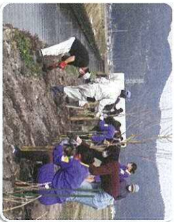
生活環境の緑づくり