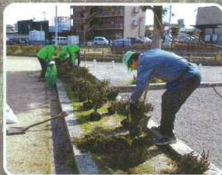
生活環境の緑づくり