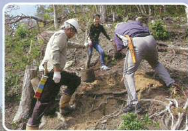
ふれあいの森づくり