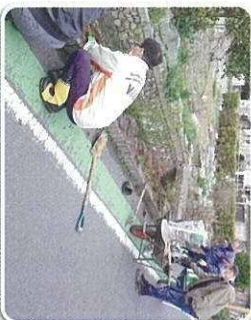
生活環境の緑づくり