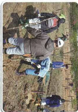
ふれあいの森づくり