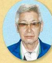
山形・霜降 レインボータウン 松島 只和