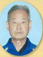
五十川・米井 山村 浩三 深溝 湖畔の郷 やわらぎ北の町 藤本 太平治