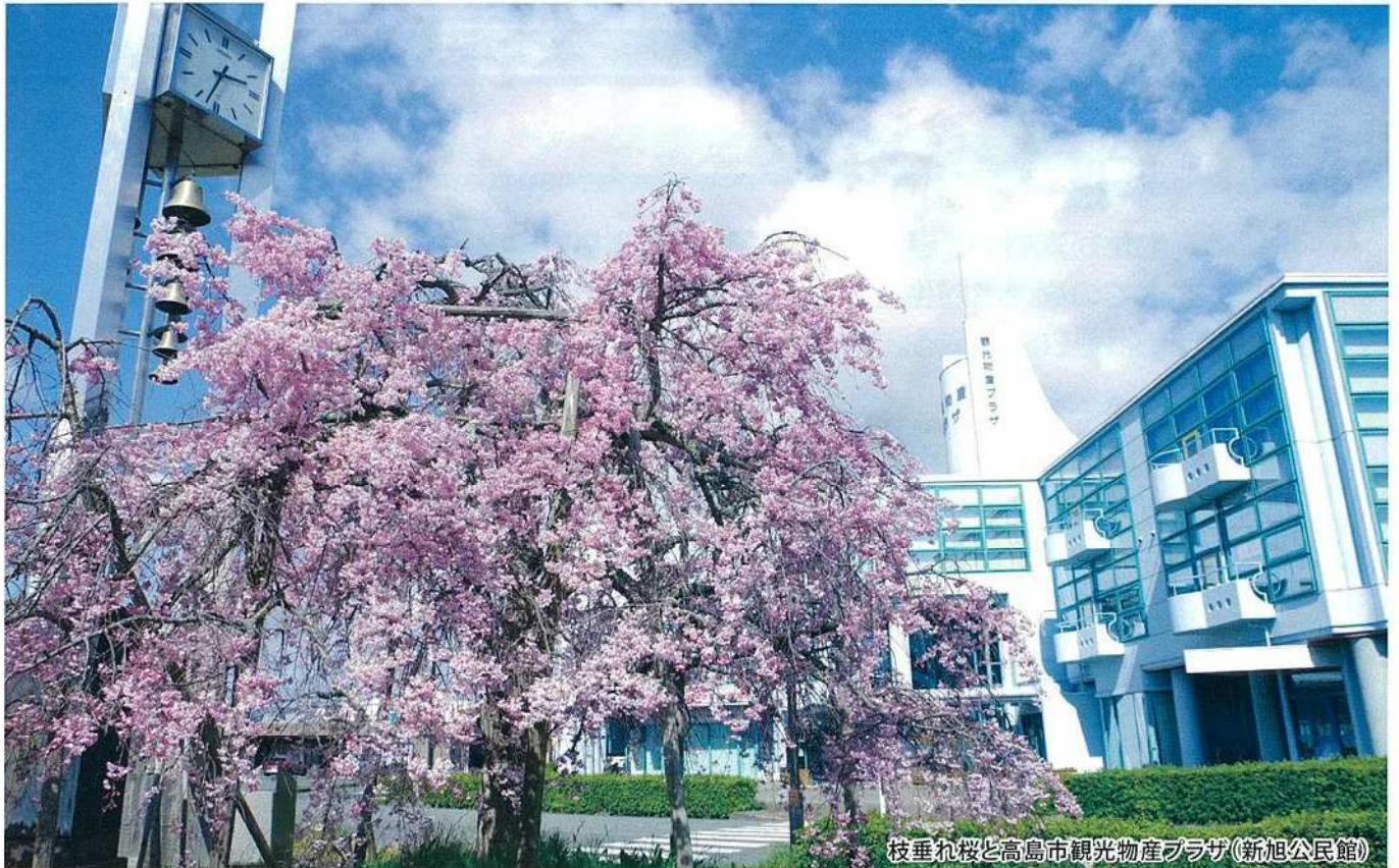
枝垂れ桜と高島市観光物産プラザ(新旭公民館)

発行者 新旭民生委員児童委員協議会 連絡先 高島市役所社会福祉課 25-8120