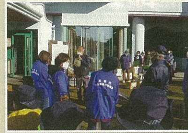
障害者部会による施設訪問(12月8日/大阪自彊館・さわやか荘)