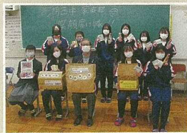
12月に歳末贈呈品配布活動(兼見守り活動)を実施しました。

今年は、湖西中学校家庭部「笑顔届け隊」の皆さんから訪問活動に役立ててくださいと新旭民児協にティッシュケースとメッセージカードを届けて頂きました。歳末贈呈品配布活動に活用させていただき、対象の方々に思いやりの心をお届けしました。