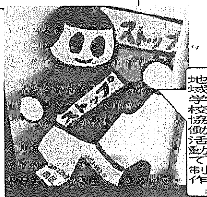
地域学校協働活動で制作