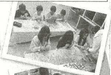
【シジミの貝殻を使った ストラップ作り】