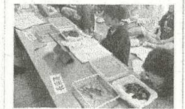
【湖底の砂や泥の観察】