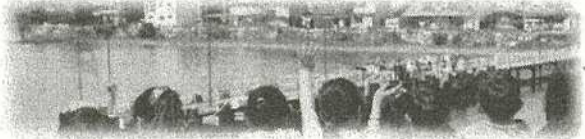
【今津港を出港する様子】

5月13・14日、5年生がフローティングスクールへ行ってまいりました。これは、昭和58年に始まった県の事業です。43年も前から続いていますので、保護者の中にも子どもの頃に「うみのこ」に乗ったという懐かしい記憶をお持ちの方がおられるのではないかと