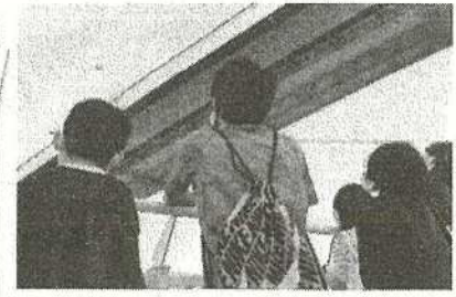
【湖上から眺める琵琶湖大橋】