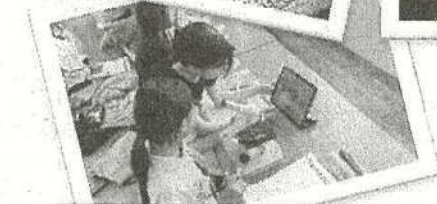
【プランクトンの観察】