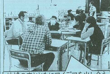
地域の方とともにアイデアを出し合う