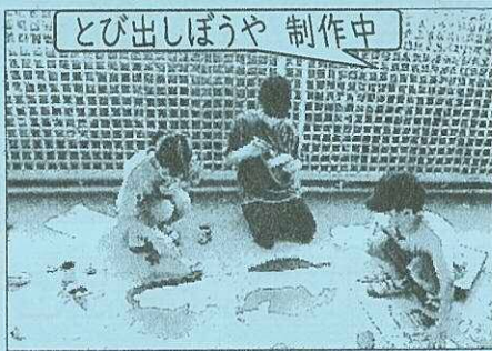
とび出しぼうや 制作中