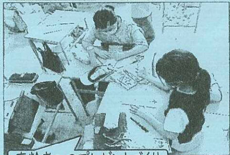
高齢者へのプレゼントづくり