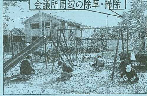
会議所周辺の除草・掃除