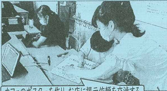
カフェのポスターを作り お店に掲示依頼を交渉する