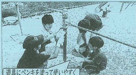
遊具にペンキを塗って使いやすく

下の表に子どもたちのアイデアによる各地区の活動をまとめました。この夏に開催されるものもあります。地域のみなさまのあたたかい声援「小学生、なかなかやるなあ」をお待ちしています。