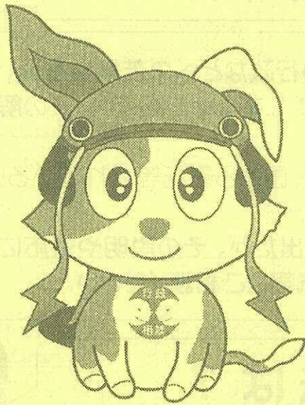
滋賀ご当地キーン「びわんこ」

国の事務に関する苦情や意見・要望は あなたのまちの 行政相談委員 までお気軽に ご相談ください。