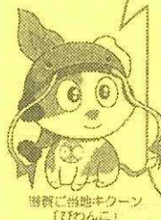
総務省当地キーン 「びわんこ」

「制度や仕組みがよく分からない」「苦情を申し出たが、その説明や対応に納得がいけない」などお困りのことがありましたら、お気軽にご相談ください。