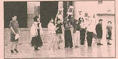
人権にこにこ集会