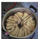
第22話 法事料理でもてなし～浦の集落が守って来た器と料理～