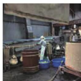
第29話 高島の酒 上原酒造～天秤搾りと情熱～