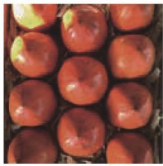
第3話 柿の桃源郷～本当に美味しい柿を知っていますか？～