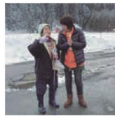
第16話 移動販売車は今日も行く～食がつなく人と人～