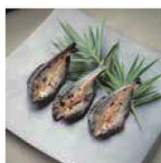
第24話 天然鮎がのぼる川～築漁とあたりまえにある奇跡～