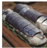
第25話 鯖街道と花火～地子原集落の夏の1日～