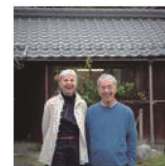
第32話 自分の尺度で生きる～高島クラフトライフ～