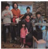
第5話 未来系里山生活～藤村家のくらしのかたち～