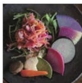
第6話 シェフズホームパーティー～マキノの羨ましいコラボレーション～