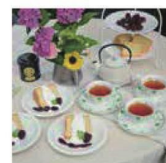
第28話 アドベリーのあたるテーブル～収穫日だけの贅沢なひととき～