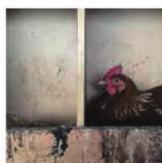
第8話 鶏をいただきます～絶品!親子丼の話～