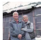
第12話 国境のマザーテレサ～子供たちに本当の食を届けたい～