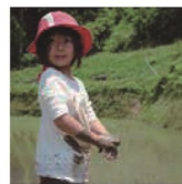
第21話 高島の酒 福井弥平商店～棚田と育つ酒～