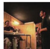
第33話 ジェラートとコーヒー～マキノの果実と世界のコーヒーが出会った～