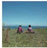
第17話 八木さんの今津の暮らし～そこにある美味しいもの～