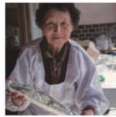
第9話 おっさん林川～集落の丁寧な暮らし～