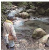
第19話 山と川からいただきます～朽木の自然からのおすそわけ～