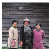
第2話 集落のおもてなし～仲良し3人娘の郷土料理～