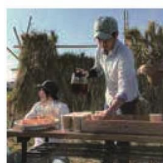
第14話 湖地考知(コチコチ) プロジェクト～食を知れば明日が見える～