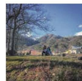
第18話 冬の森の教室～ジビエが焼けた～