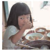
第36話 高島の無添加生活～願いを叶えたりピンポイントの理想郷～

びわ湖の西岸に位置する滋賀県高島市は三方を山に囲まれ、安曇川を中心とした幾つもの美しい川がつくる扇状地が琵琶湖に面した平野部を形成しています。