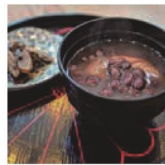
第10話 あずきのパトン～朽木のおばあちゃん達のクリスマス会～