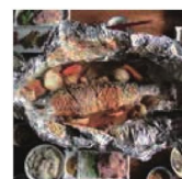
第15話 かばたの有る生活～沸水の町 針江の郷土料理～