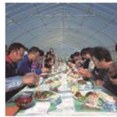
第34話 「サトパス」と食～3つのオリジナルツアー～