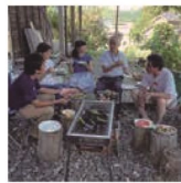
第35話 栗本さんの杉と根切り杉の家に住む家族～時には時に委ねる生き方を～