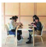
第4話 蕎麦打ちしよう!～高島高校取材チームのワクワク蕎麦体験～