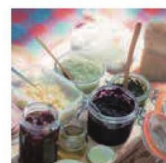
第27話 カヌーでピクニック～家族で作るささやかで満ち足りた日々～