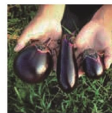
第23話 茄子3兄弟～美味しいからみんなつながる～