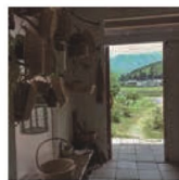
第7話 土と水と菌と知恵～高島野菜の発酵料理教室～