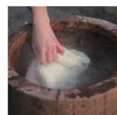
第11話 餅つきしよう!～高島高校取材チームのワクワク餅つき体験～