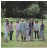
第20話 森の中の料理教室～個性派野菜のマエストロ～