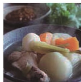
第13話 哲学者の野菜作り～冬野菜の暖か食事会～