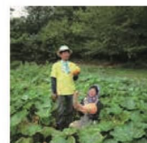
第31話 ずんだ耕園の挑戦～不思議野菜の懐石料理～