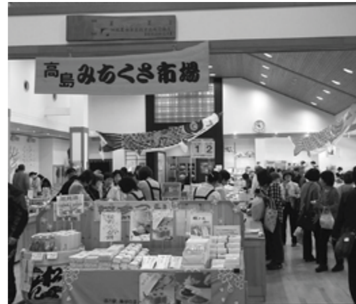
たくさんの観光客が訪れる「あどがわ道の駅」