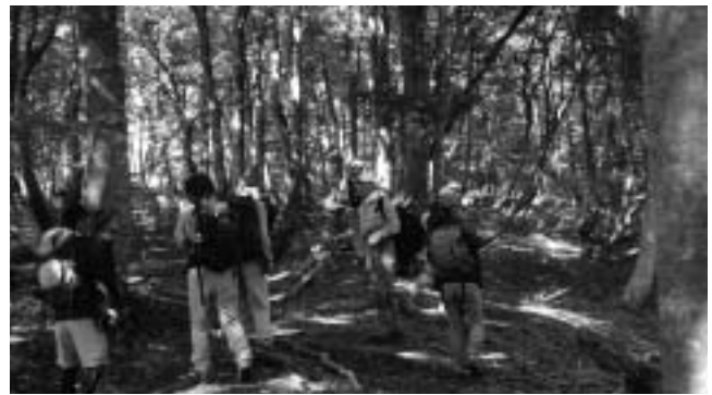
多くの観光客が見込めた高島トレイル

高島市の観光振興の取組みは合併から今まで、滋賀県より経済振興特区として、当市の自然環境と地域資源を活かしたエコツーリズムの推進を柱にした「びわ湖里山観光振興特区」の地域指定を受け、数々の支援を受けながら産業振興に努めてこられました。この特区支援は5年間のもので、今年3月で終了するものです。以下4点について伺います。