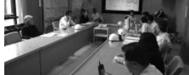
もしもの災害に備えての防災訓練

問 指定管理者制度は、市施設の管理に民間手法を導入して行政サービスの向上や管理経費の節減をしようとするものです。これから更新の手続きをする施設が沢山ありますので、この進め方について伺います。特に、市への納付金を受ける案件、管理料を払う案件について、「道の駅あどがわ」の管理者を選定する際の課題を受けて、今後の考え方を伺います。 答 指定管理者制度運用指針の見直しにつきましては、標準的収支の示し方、指定管理料・納付金の考え方など、今年度の更新事務を踏まえ、見直しを検討しています。また、指定管理者候補者選定委員会の方、位置づけについても指針の中でより明確にしたいと考えています。