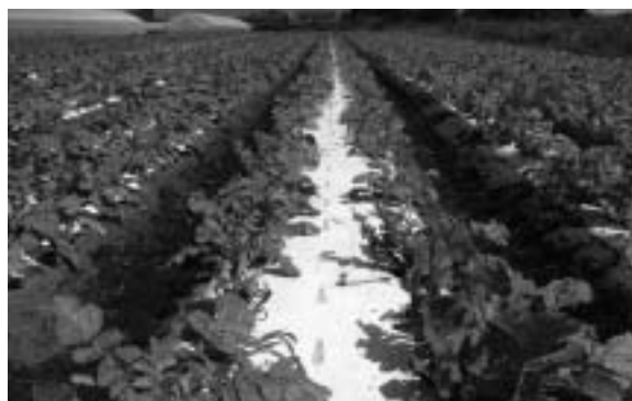
地元農産物でおいしい給食を