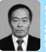
大日 翼 議員

高島市の観光振興の取組みは合併から今まで、滋賀県より経済振興特区として、当市の自然環境と地域資源を活かしたエコツーリズムの推進を柱にした「びわ湖里山観光振興特区」の地域指定を受け、数々の支援を受けながら産業振興に努めてこられました。この特区支援は5年間のもので、今年3月で終了するものです。以下4点について伺います。