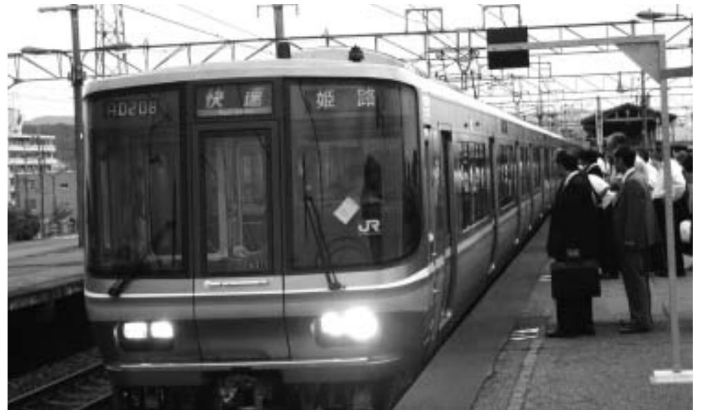
増便と暴風対策が求められるJR湖西線

答 市長 市民皆様の日常生活と深い関わりのある国、県、JRの各事業の進捗状況をタイムリーに情報発信されたいと考えます。特に