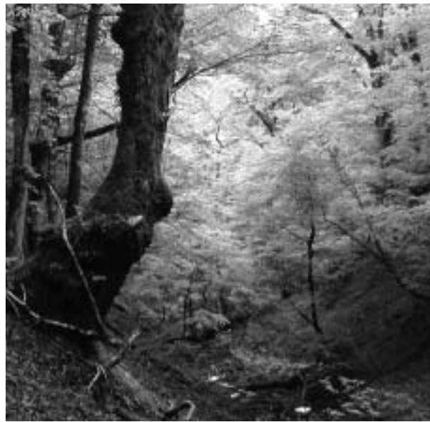
豊富な水源を守る条例を

問 30の水道水源林で伐採規制がある保安林割合は？ 水源を守る条例制定を。 答 民有林の保安林指定は、全体面積の約21%となっております。近年、その豊富な水資源を求め、外国資本によ