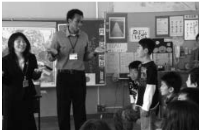
ALTによる充実した授業

蔵書の整備状況を把握しながら、その充実を図っております。また各学校では、司書教諭を中心に計画的かつ組織的に学校図書館経営を行っており、読み聞かせや訪問貸出しなど、公立図書館との連携を深めて、読書活動の推進に努力しています。 問 外国語指導助手（ALT）の確保について 答 小学校での英語必須化で、優れた指導助手を確保するための手立てが必要では。 答 外国語指導助手の人材確保はしっかりとできており、各学校では生き生きと充実した授業が展開されています。