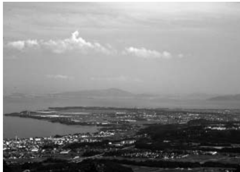
豊かな自然と美しい風景を活かした着地型観光を

答 市長 高島市独自の認証制度と地産外商の取り組みを進めます。本市独自の農産物認証制度については、新年度早々にも消費者・