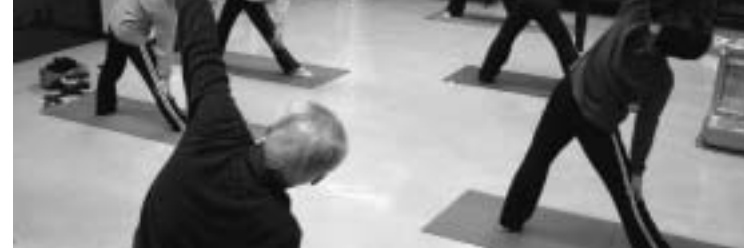
地域住民の交流の場である公民館活動

問 学校卒業後の社会教育の充実について、公民館活動は社会教育の最先端でありコミュニケーションセンターとは違います。違いをしっかりと理解し、より充実した体制を確立する必要がありますがその対策は。 答 公民館活動は地域における現代的課題の解決に繋がる学習を多く取り入れるとともに、地域住民の交流の拠点として管理運営していくことが大切であると考