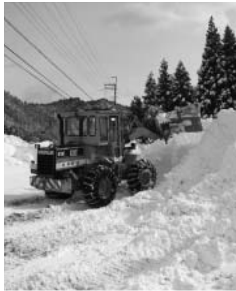
市民の生活を守る除雪作業

問 昨年12月末からの積雪による被害について市内県道、国道の通行止めによる損害や、JR湖西線の運休、通学バスの遅れなどによるライフラインの混乱や打撃について伺います。