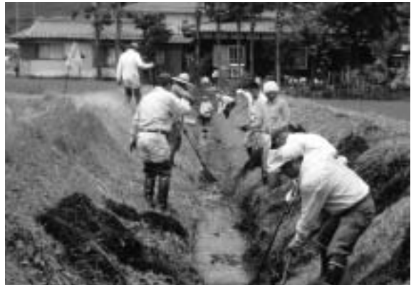
地域の河川清掃にはまちづくり交付金を

議決案件として、①財産の処分について議決を求めることについて(永田区)、②高島市辺地総合整備計画の策定につき議決を求めることについて(鹿ヶ瀬辺地)、③高島市辺地総合整備計画の策定につき議決を求めることについて(黒谷辺地)、④高島市みん