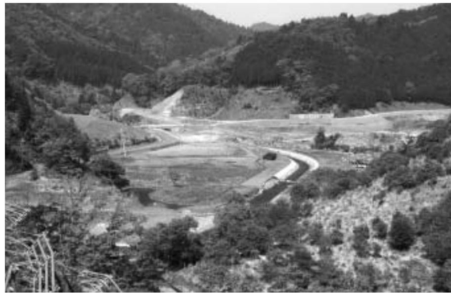
必要性が問われた北川ダム建設

者の意見等を踏まえながら、市内の河川整備計画を早急に取りまとめていただき、沿川住民が安心して生活できる河川行政を推進されるよう、強く求めてまいります。