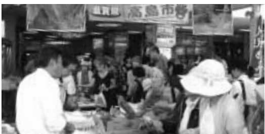
賑わいを見せる産直市

答 近畿・中京圏の企業や市場、大学生協等をターゲットに販路拡大を図るとともに、行