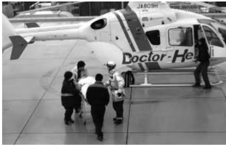
救命率向上が期待されるドクターヘリ

ヘリの導入について検討されてきましたが、医師等の確保が難しいことや、運航費用等の負担が多くなることから、大阪府との共同利用で導入されることになりました。現在、こつした動きを受けて、消防機関、受入医療機関、大阪府、基地病院等におきまして、共同利用に向けての協議、調整がなされています。