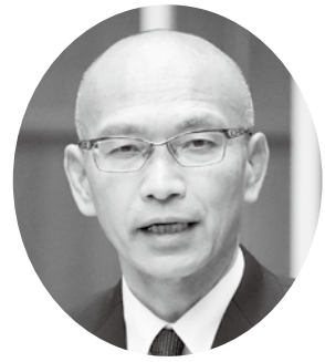
山下 巧 議員