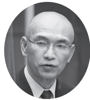
山下 巧 議員