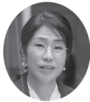
板持 文子 議員