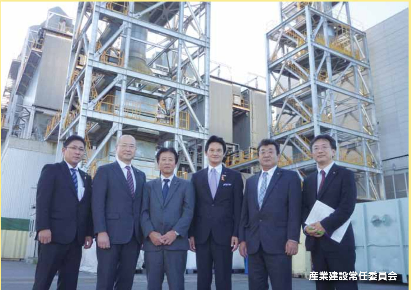
産業建設常任委員会