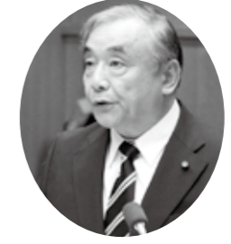
栗津 泰藏 議員

問 職員による盗撮事件というあるまじき不祥事や、公金を扱う中での問題、さらに、市の補助団体での不祥事案等の発生は、市民からの信頼を失い、市政運営全体に支障が生じることを、全ての職員が認識すべきである。どのように受け止めるか。