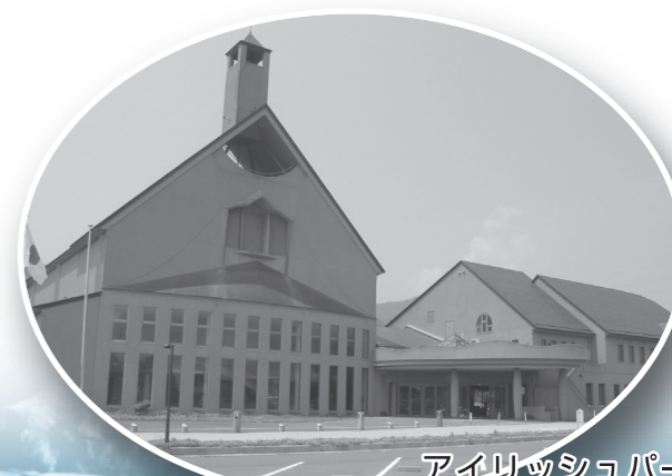
アイリッシュパーク