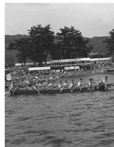
昨年まで開催されていた西びわこペーロン大会

問 大会がなぜ中止になったのか。高島市としてこの大会を今後どのように考えていくのか。 答 産業循環政策部長 西琵琶湖ペーロン大会が中止になったことは責任を痛感いたしております。このペーロン大会は、市として大