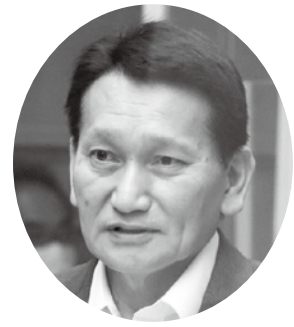
藍原 章 議員