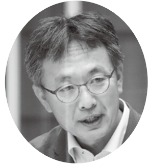
是永 宙 議員