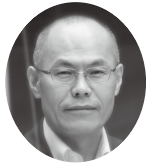
廣部 真造 議員