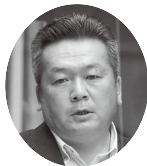
澤本 長俊 議員

日本の100歳以上の人口は4年前で6万9700人、現在は8万6500人。高島市でも10年前と比べ、90歳代も100歳代も約2倍になっている。まさに人生100年時代を迎えようとしている。 一般的に定年を迎え老後になるといわれる年齢が65〜70歳。そこから考えると100歳までまだ30年以上の時間がある。この30年以上の時間をどのように過ごしていくか、過ごしていけばよいのかと考えておられる方は少なくないと思われる。そこで、老後の人