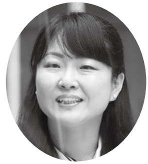
磯部 亜希 議員