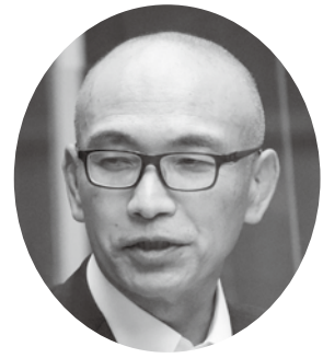
山下 巧 議員