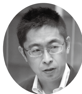
早川 浩徳 議員