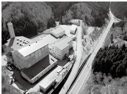
現 高島市環境センター

周辺地域のご意見等については、建設検討委員会の各委員にお伝えしており、その上で様々な角度からご審議いた