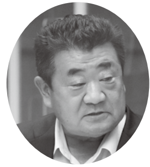
高木 広和 議員