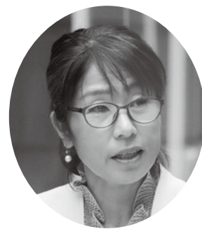
板持 文子 議員