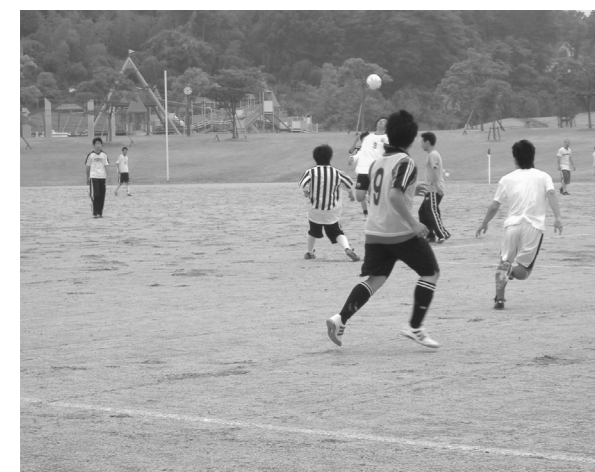
健康の森梅ノ子運動公園

さらに、議第273号・公の施設の指定管理者の指定につき議決を求めることについてほか8件、合わせて12議案でありました。去る、12月7日および15日に当委員会を開き、当局の説明を求め、慎重に審査を致しました結果、本紙19頁に記