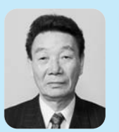
大西 勝巳 議員