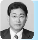
駒井 芳彦 議員

地方自治法では基金の保管について「最も確実かつ有利な方法で保管しなければならぬ」と規定されている。通常は金融機関に預金して安全に保管するが、ペイオフが全面解禁され、基金の運用についてはより慎重な対応が求められる。基金が設置されているが、それらの保管方法について問う。