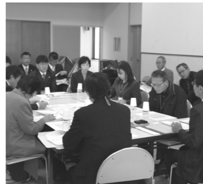
財政再建に向けての事業仕分け作業

現下の当市の財政状況は、国が進める三位一体改革の影響等による地方交付税の減少や急激な扶助費・公債費等の義務的経費の増大等により極めて厳しいのが実状であります。