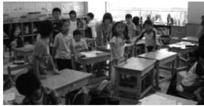
学校で楽しく過ごす子どもたち

農作物被害対策事業は、防護柵1ヶ所につき受益者が2戸以上で受益面積が50a以上のものに限りなっております。被害は個人で対策を行うよりも集落でより広域的に取り組んでいただくことが有益であると考えています。他事業の事業種目で獣害柵の設置が可能なが場合があるので、その方法も検討願います。