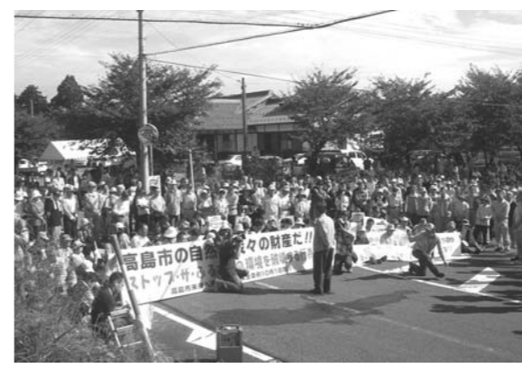
「不法投棄事件」昨年11月に一部搬出されましたが、搬入業者による早急な全量撤去の実施に向けて、県担当部に強く要望してまいります。また、周辺の土壌・水質から重金属は検出されませんでした。引き続き監視体制等の強化による再発防止に努めてまいります。

地域住民のみならず、まの心情に寄り添い、指導監督権限のもと毅然とした対応を約束します