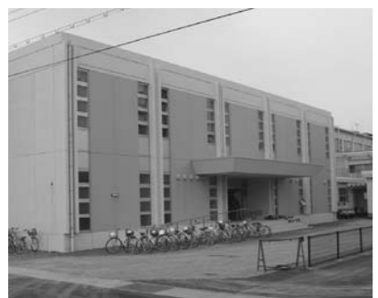
安曇川中学校体育館

「ゆとり教育」から「詰め込み教育」への転換ではなく、学習時間を確保し、基礎的な知識・技能の定着とそれらを活用する能力の育成をめざすものと考えています。移行に際しては学校任せではなく、教職員の