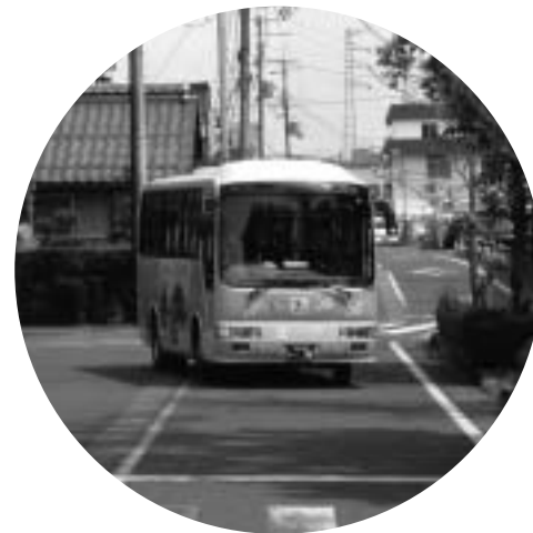
市内を運行する循環バス

答 広告媒体として非常に身近で目に付きやすく、広告効果がダイレクトに伝わることから、有効な手段と考えられます。