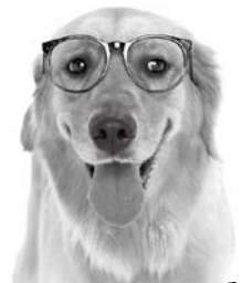
自家用広告物の例