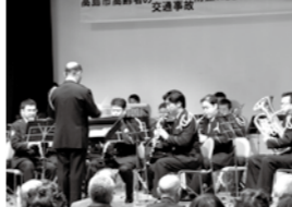
最後に飾った県警音楽隊による演奏会

このような状況の中、高齢者の犯罪被害と交通事故に歯止めをかけ、安全で安心なまちづくりを推進するため、2月19日に高島市と高島警察署が「高島市の犯罪被害・交通事故防止に関する協定」を締結しました。今後は、この協定に基づき、密な情報共有はもろろん、高齢者犯罪被害警戒情報・高齢者交通事故警戒情報の発令、関係機関・団体との連携した啓発活動を行う予定です。