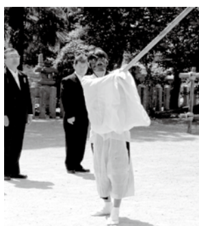
【写真③】 国狭槍神社の春の祭礼

す。この祭りは、かつては行列の中に神牛（かみうし）が加わっていたことから「牛祭り」と呼ばれていたことが江戸時代中期に記された『近江輿地志略』に登場し、大変古くから続く祭礼であることが分かっています。その祭礼の中で行われるのが、「天狗」「王の鼻」