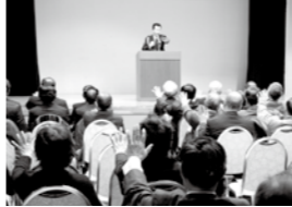
協定締結式後に行われた交通安全教室