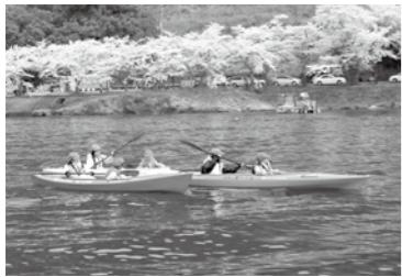
マキノ東小学校(自然体験学習)