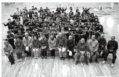
今津東小学校(地域の方としめ縄づくり)

本年度から、マキノ北小学校がマキノ東小学校と、今津西小学校が今津東小学校と統合し、新たな歴史を歩み出します。マキノ北小学校と今津西小学校では、以前から、子どもたちが合同学習を行ったり、保護者と学校・教育委員会が通学方法などを慎重に協議したりして、統合のための準備を進めてきました。