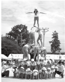
今津東小学校(組体操)