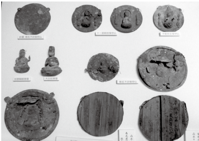
【写真】椋川山神社の懸仏群

今回追加指定となつた山神社の懸仏群は、大半が薄銅板打ち出し像を打ち出し装飾を施した薄銅板に針金で固定するタイプのものです。製作年代は、懸仏の量産化が進む室町時代頃と見られます。（下写真参照）