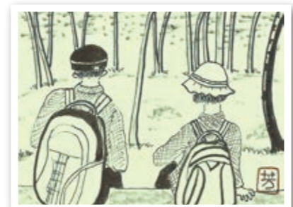
♪マキノ高原からセラピーロードをゆっくり歩いて丸太のベンチにドッコイショ! ♪ (頃常 芳子 今・今津)

スマートフォンや携帯電話などからの応募も大歓迎! また、市ホームページではカラーで掲載!