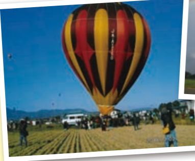
熱気球 (北川 民子 高・鴨)