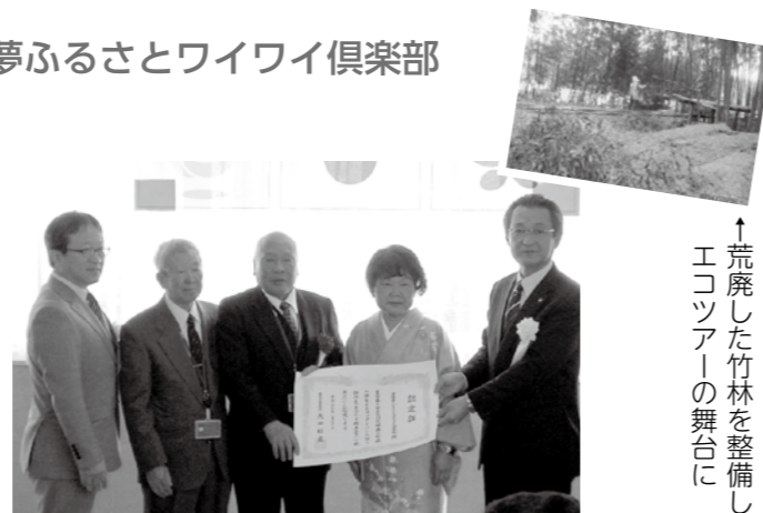
↑荒廃した竹林を整備しエコツアーの舞台に

同倶楽部はエコツアーを企画する市民有志の団体であり、「新竹取物語」と名付けた安曇川の竹林整備や、竹林を舞台にしたエコツアーが評価されました。(観光振興課)