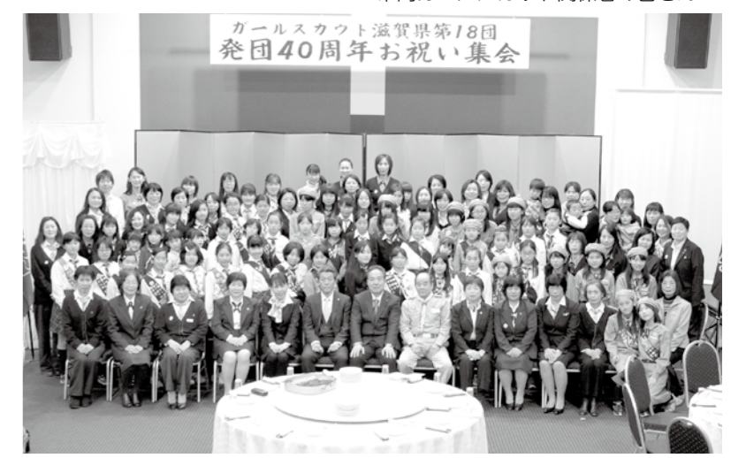
市内ガールスカウト関係者の皆さん

式典では、来賓のお祝いの言葉や40年間の活動を振り返るスライドショー、ガールスカウトに所属する子どもたちによる鼓隊の演奏や歌などが披露されました。琵琶湖湖岸清掃やユニセフ募金、野外活動などのたくさんの活動とおして、「社会に役立つ女性の育成」を目指し40年前に21人の団員から始まったガールスカウト。今後もますますの活躍が期待されます。(青少年課)