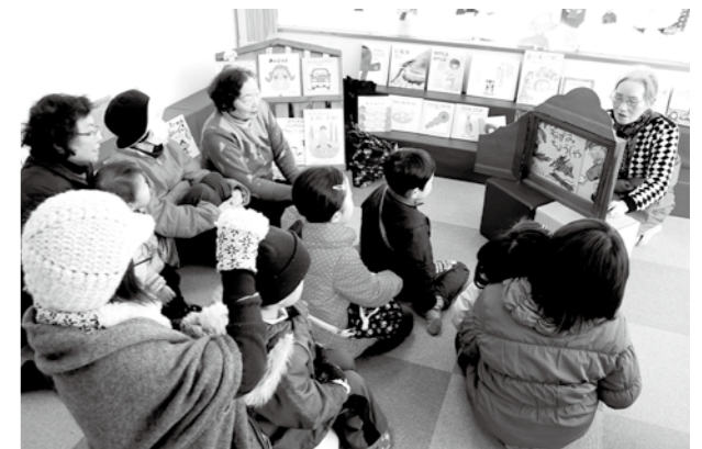
「かめのへや」で紙芝居を行うメンバーと聞き入る子どもたち

同会では、土曜日の午前中にAコープ今津店で「かめのへや」を開室し、買い物中のお子さん連れに絵本や紙芝居の読み聞かせなどを行っています。訪れた人たちの笑顔と「また来るね」の言葉をやりがいに、今日も一歩一歩活動の環を広げておられます。(秘書広報課)