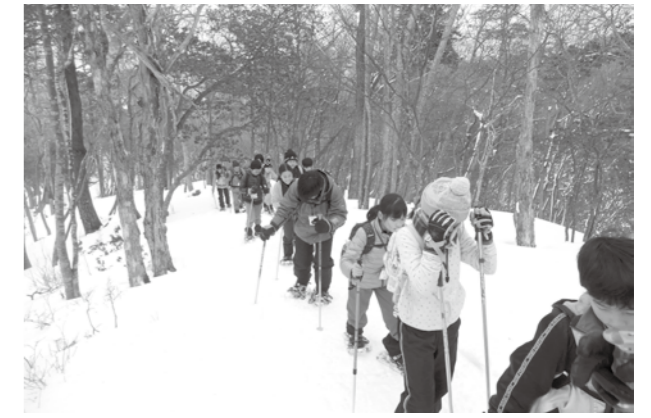
天気もよく、前日に降った新雪はふかふか

また、下山後、ボランティアの方々々がぜんざいを準備してくださり、疲れた身体には、甘くて暖かいぜんざいがとてもおいしく、冷えた身体が温くなりました。(青少年育成市民会議)