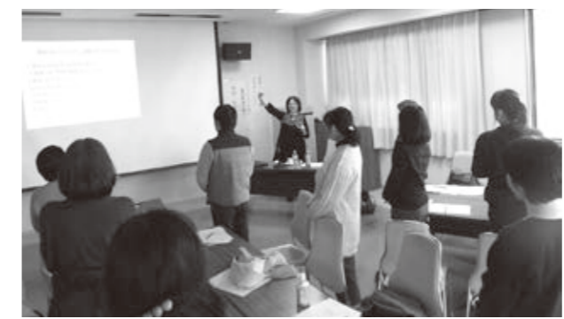
熱心に話を聞く受講生

受講生からは、「今日のお話を聞き褒めることの大切さを感じました。」「体幹ができていないと姿勢が維持できなかつたり、崩れてしまつたり、疲れやすいなど具体的なお話が分かりやすかつたです。」などのご意見・感想がありました。(健康推進課)