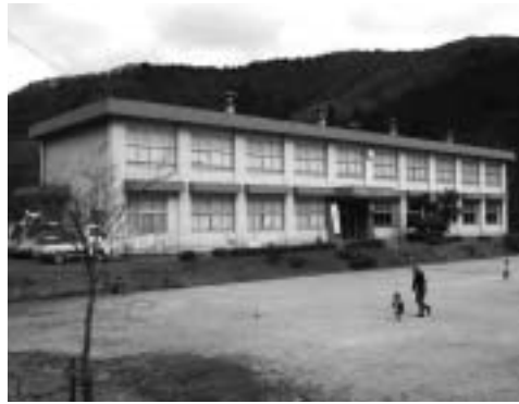
今津西小学校椋川分校

・今津西小学校椋川分校の廃止について 7月20日の定例教育委員会で提案された本議案について、対象となる保護者の方から、椋川分校への就学を希望しない旨が書面提出されたため、全員一致でこの議案を承認しました。