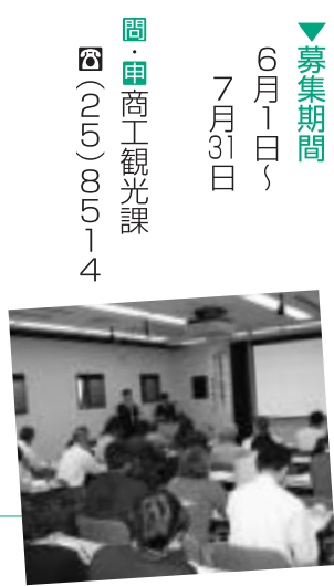
図・申商工観光課 ☎(25)8514