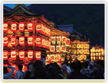
「大溝祭」 大溝祭は、湖西唯一の曳山 祭で、提灯をまとった曳山 はとても幻想的やで♪ (たかP)

スマートフォンや携帯電 話などからの応募も大歓迎! また、市のホームページではカラーで掲載!