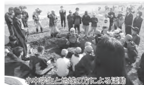
小中学生と地域の方による活動

これらの活動を通して、「地域とともにある学校づくり」が着実に実を結んでいることを改めて実感したところであり、今後も、地域と学校、人と人をつなぐ活動を充実させ、高島の未来を切り拓く人づくりに努めてまいります。ご理解とご協力をよろしくお願いいたします。