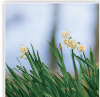
「春の足音」 水仙の花を発見！春が近づいてきたとを感じるな♪ (しまK)