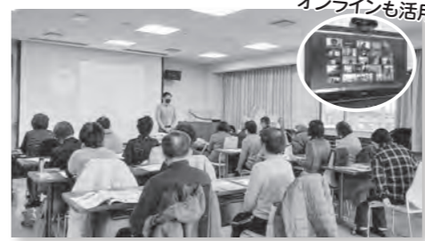
オンラインも活用!

1月からオンライン体操教室を開催しています。いろいろな機会です。介護予防に取り組めるよう、これからもこのような教室を企画していきます。