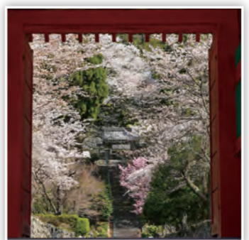
「エドヒガン」 大きなエドヒガンザクラが、花を咲かせていたで！ (たかP)

スマートフォンや携帯電話などからの応募も大歓迎！また、市ホームページではカラーで掲載！