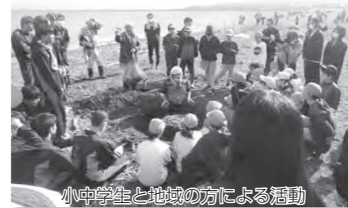
小中学生と地域の方による活動

これらの活動を通して、「地域とともにある学校づくり」が着実に実を結んでいることを改めて実感したところであり、今後も、地域と学校、人と人をつなぐ活動を充実させ、高島の未来を切り拓く人づくりに努めてまいります。ご理解とご協力をよろしくお願いいたします。