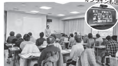
オンラインも活用!

1月からオンライン体操教室を開催しています。いろいろな機会です。介護予防に取り組めるよう、これからのこのような教室を企画していきます。