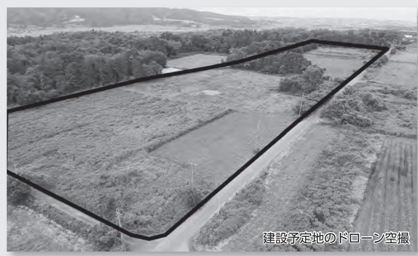
建設予定地のドローン空撮

ごみ処理施設建設検討委員会で審議・検討を重ね、令和5年12月から実施したパブリックコメントを経て、「新ごみ処理施設整備基本計画」を策定しました。 この計画は新ごみ処理施設整備の基本方針や施設規模、環境保全目標など、施設整備から運営にかけての方向性を示したものです。 今後は、施設整備に向けた基本設計に着手し、令和11年度中の焼却施設、令和14年度のリサイクル施設、それぞれの供用開始に向け取り組みを進めていきます。