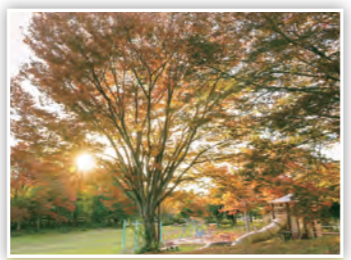
「宮の森公園」 今津地域にある宮の森公園では、もみじがたくさんあり、おすすめの紅葉スポットやで! (たかP)

スマートフォンや携帯電話などからの応募も大歓迎! また、市ホームページではカラーで掲載!