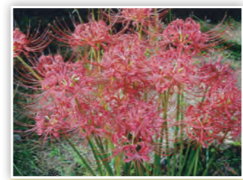
「彼岸花」 びわ湖畔に咲く赤い花。曼殊沙華とも言われます。季節を感じる1枚です。