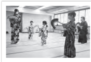
(左上) 着付け&日本舞踊

子どもたちは上達が早く、どの教室でも真剣に取り組む姿が見られました。(社会教育課)