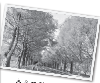
高島で癒される毎日!