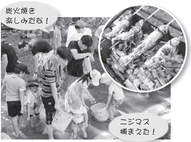
炭火焼き 楽しみだな!

安心して暮らし続けられるマキノのまちづくり マキノまちづくり協議会では、マキノ地域をいつまでも住み続けられるまちにするために、地域のさまざまな団体が区自治会の担い手不足などの課題解決に向けて連携して取り組めるよう、活動しています。