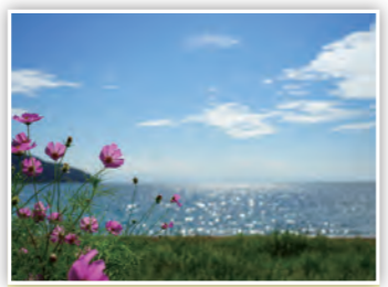
「コスモスとびわ湖」 秋を代表する花の1つであるコスモス！ びわ湖と一緒に眺めるのもいいね♪ (しまK)

スマートフォンや携帯電話などからの応募も大歓迎！また、市ホームページではカラーで掲載！