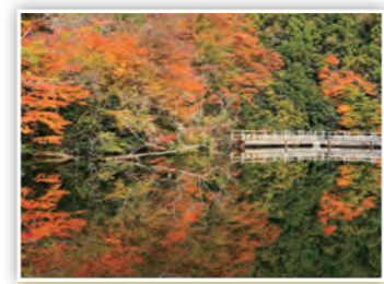
「もみじ池」 風がやんだ瞬間は池が水面鏡となって、息をのむほど美しい紅葉を楽しむことができるで！ (たかP)