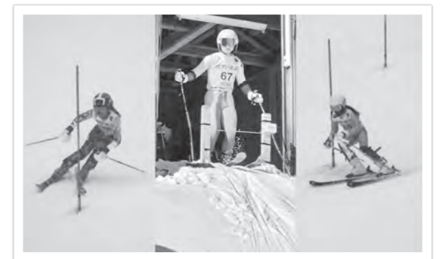
アルペン競技の選手たち