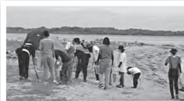
ガールスカウト滋賀県第18団