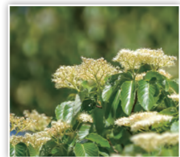
「ミズキ」 森林公園くつきの森でミズキの花を発見! 5~6月頃にかけて白くて小さな花が咲いてるよ! (しまK)