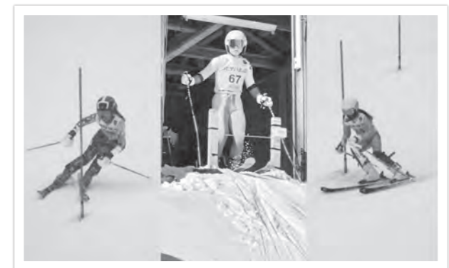
アルペン競技の選手たち