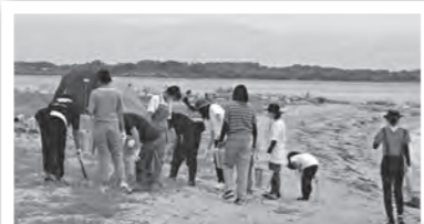
ガールスカウト滋賀県第18団