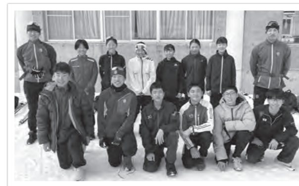
クロスカントリー競技の選手たち