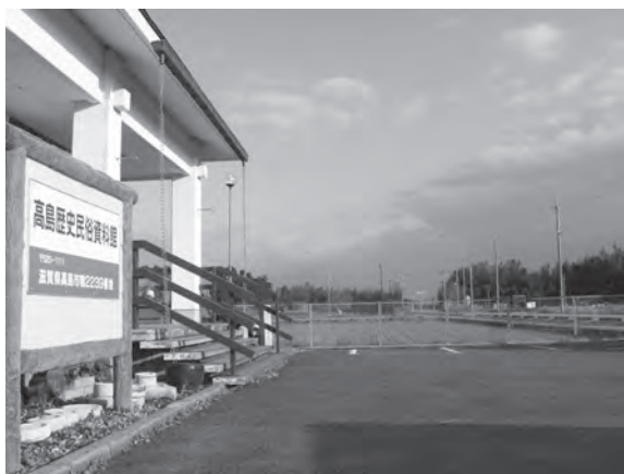
資料館から鴨稻荷山古墳・県道23号線を望む

高島歴史民俗資料館は高島市鴨2239番地に所在します。展示室には土中から出土した考古資料を中心に展示しています。特に、鴨稻荷山古墳と鴨遺跡は資料館の周辺に所在する古墳・遺跡ということで、多くの資料が展示されています。資料館から北へ150mの場所にある鴨稻荷山古墳は、明治35年(1902)8月9日に東を走る道が県道に昇格するための改